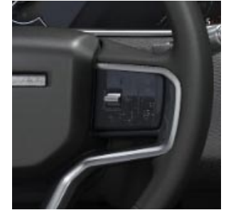
LEVE DI SELEZIONE MARCE AL VOLANTE