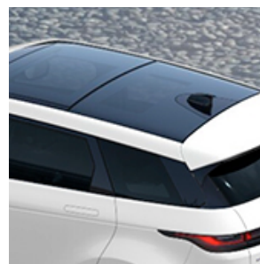
TIPO DI TETTO