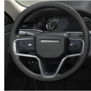
PIANTONE DELLO STERZO